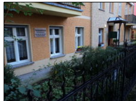
Außenansicht der Ferienwohnung

Gleichzeitig besteht mit der unmittelbaren Anbindung an das Straßen- und S-Bahnnetz die zügige Besuchsmöglichkeit des Zentrums der Hauptstadt Berlin.