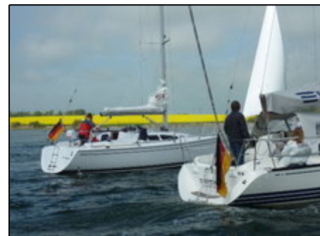
Rapsblüte im Mai

Die Schlei, der einzige Fjord Deutschlands ist eines der beliebtesten Segel- und Feriengebiete in Schleswig-Holstein. Die Landschaft, die der Serie "Der Landarzt" als Kulisse diente, ist dementsprechend malerisch und abwechslungsreich zugleich; ein Paradies für alle mit einem hohen Erholungswert. Felder, Wiesen und die kleinen berühmten Schleidörfer wie Arnis und Kappeln sind hervorragend für die Familie geeignet. Museumseisenbahn, Schleirundfahrt, Wikingermuseum Schleswig, Surfen u. Segeln