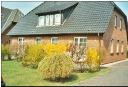
Haus Rugstieg in Wyk

Sehr gemütliche Ferienwohnung im EG mit Terrasse für 2-4 Personen mit 2 Schlafzimmern ... (Wg.1)