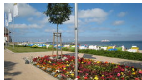
Die neue Promenade

Gerne können Sie auch meine Web-Seite besuchen