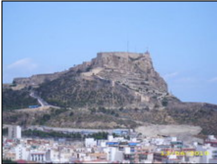
Blick auf die Burg

Ruhige Wohnung im Herzen von Alicante ,alle Vorteile einer Stadt zum greifen nahe, zum Strand und grossen Yachthafen allerdings nur 12 Gehminuten.