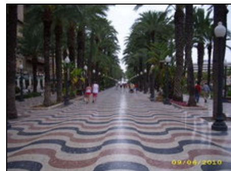
Explanada de Alicante

Märkte, Parks, Geschäfte, Museen, Burgen ... lassen keine Langeweile aufkommen. Cafès, Tapas Bars, Restaurantes laden zum verweilen ein. Die Altstadt mit Flair am Tag und in der Nacht. Der Strand und der grosse Yachthafen sind nur 12 Gehminuten entfernt. Das Wassersportangebot kennt kaum Grenzen. Abends öffnen das Casino, Bars, Discotheken. Bus/Bahn und Strassenbahn sind um die Ecke. Auto überflüssig!!