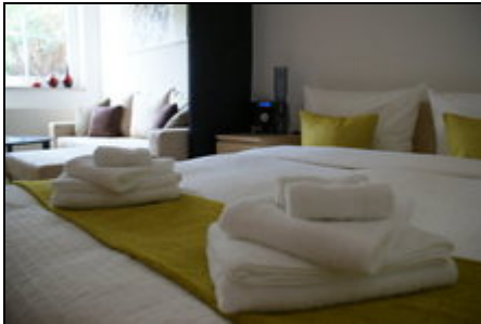
Stil und Eleganz

Diese vom DTV zertifizierte Ferienwohnung mit einer "luxuriösen Gesamtausstattung" befindet sich im westlichen Stadtteil unweit der Universität Erfurt