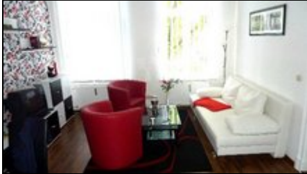
Wohnzimmer mit Schlafcouch 160 x 200