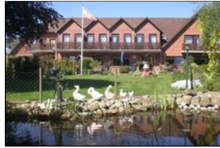
Haupthaus Pension Tüxen

Die Schlei von Kappeln nach Arnis als Wanderung oder mit dem Rad ist empfehlenswert.