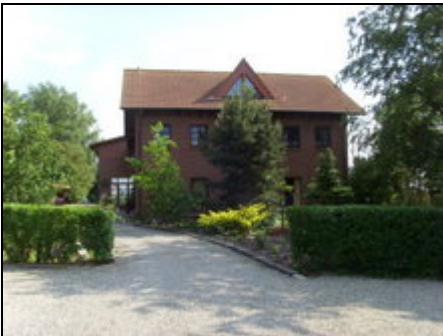
Landhaus Hofmann Polchow

In absolut ruhiger, jedoch zentraler Lage liegt unser gepflegtes Landhaus mit insgesamt 18 Wohneinheiten.