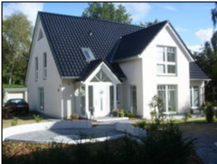
Außenansicht - Eingang