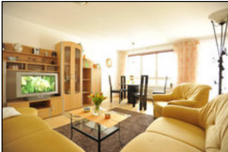
Wohnbereich - FeWo "Das Nest"

FeWo München 1-4 Pers., ca. 60 m 2 , mit TG-Stellpl., WoZi. mit Essbereich, gr. TV, SchlZi. mit Doppel-Wasserbett und TV, Einbauküche, Bad, kl. Balkon.