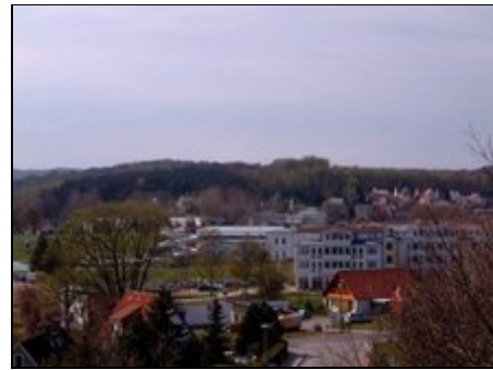
Blick von Nr.16 auf Sellin