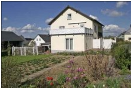
Aussenansicht mit Garten