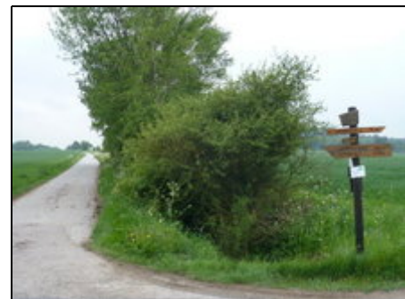
Gut beschilderte Wander- und Radwege

Dickenschied, mitten im waldreichen Hunsrück und dem Naturpark "Soonwald" ist ein idealer Urlaubsort für Naturfreunde. In unmittelbarer Nähe zum Saar-Hunsrück Steig, dem Soonwaldsteig und dem Idarwald. Direkt am Ort vorbei führt der Keltenwanderweg und der Lützelsoon-Radweg. Das UNESCO-Welterbe Oberes Mittelrheintal, die Mosel und die Nahe sind ebenso schnell zu erreichen, wie die durch Edelsteine weltbekannte Stadt Idar-Oberstein und die alte Römerstadt Trier.