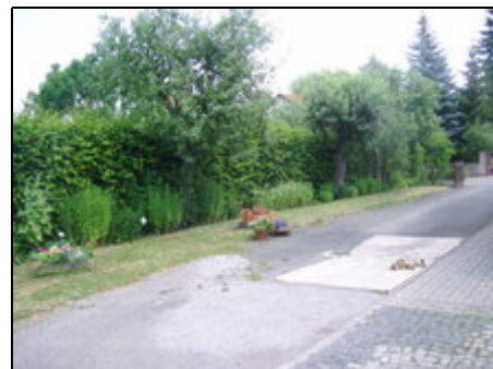
Einfahrt in das Grundstück

Die Erfurter Altstadt ist berühmt durch Domberg, Krämerbrücke, Zitadelle Petersberg, alte Synagoge und die Wirkungsstätten von Martin Luther und anderen geschichtlichen Persönlichkeiten. Zum Ferienhaus gibt es eine gute Bus- und Bahnbindung, der Bahnhof ist 500 m entfernt. Die Klassikerstadt Weimar liegt 35 km entfernt, die Bachstadt Arnstadt etwa 20 km. Transfer ist auf Wunsch möglich. Ein Freibad ist in der Nähe; es gibt gute Fahrradwege nach Erfurt und Umgebung.