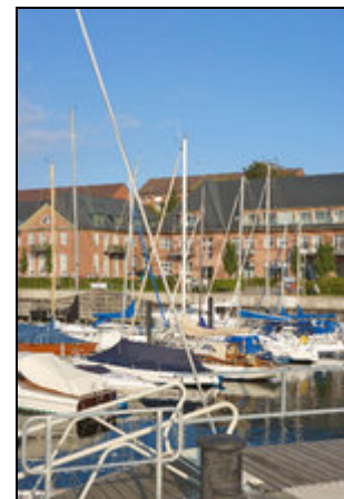
Marina Sonwik direkt vor der Tür

Die Wohnung befindet sich in einem traditionsreichen Gebäude, charaktervoll saniert, direkt an der Uferpromenade. Aus den auf der Promenade zur Verfügung stehenden Strandkörben genießen Sie den Blick übers Meer und das Nachbarland Dänemark. Als Marina bietet Sonwik Wassersportlern jeden Komfort. Die ansässige Gastronomie verwöhnt Ihren Gaumen mit mediterranen Köstlichkeiten, Einkaufsmöglichkeiten sind in der Nähe vorhanden, die Innenstadt Flensburgs ist in wenigen Minuten erreichbar.