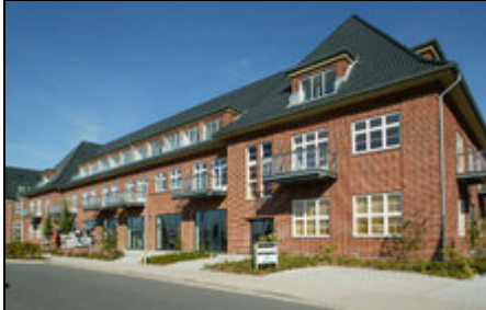
Tolle Ambiente in Sonwik

Maritimes Urlaubsflair genießen: Stilvolle Ferienwohnung über zwei Etagen mit Blick aufs Meer in historischem Gebäude, direkt am Fjord gelegenen.