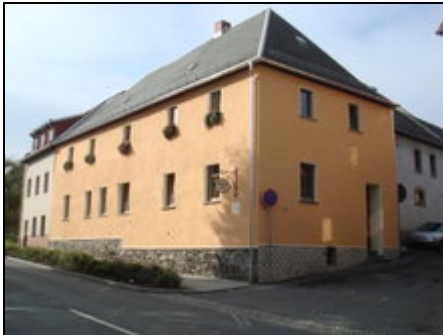
Unser Haus - Straßenansicht

Unsere Ferienwohnung befindet sich auf einem Bauernhof am Rande von Auma mit einem großen Garten zum Spielen und entspannen.