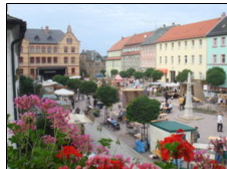
Marktplatz von Auma

Also kommen Sie - entdecken Sie Thüringen!