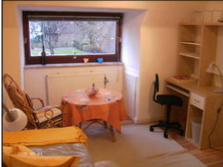
Wohn- und Schlafraum

Freundliche, moderne, helle 1-Zimmer Ferienwohnung, mit Küche und Voll-Bad. Haustiere sind willkommen! Nichtraucherwohnung.