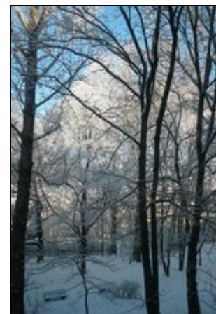
Fenster zum Hof

Ruhig und trotzdem mittendrin: U-Bahn, Straßenbahn und S-Bahn Anschlüsse, sowie der Ostbahnhof befinden sich in unmittelbarer Nähe. Kneipen, Restaurants, Bars und kleine Geschäfte im beliebten Simon-Dach Kiez liegen in Fußweite. Der Alexanderplatz, Ausgangspunkt für viele Sehenswürdigkeiten, mit vielen Einkaufsmöglichkeiten ist nur 3 U-Bahn-Stationen entfernt. Die angrenzenden Stadtteile Prenzlauerberg und Kreuzberg sind ebenfalls schnell mit öffentlichen Verkehrsmitteln zu erreichen!