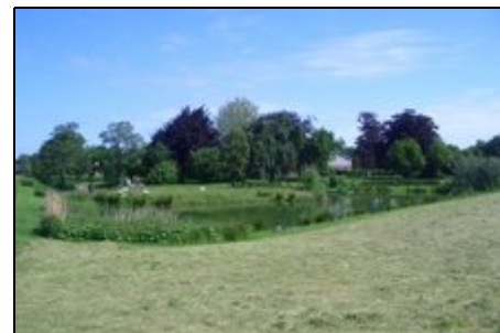
Garten und Teichanlage mit Insel

Rabenkirchen, inmitten der schönen Landschaft Angeln gelegen bietet eine Vielzahl von interessanten Besichtigungszielen. Die Ostsee ist in 10 Minuten zu erreichen, die Schlei in 5 Minuten, eine Fördelandschaft mit zahlreichen Bade-, Angel- und Wassersportmöglichkeiten. In der nahen Umgebung befinden sich ein Ponyhof, ein Golfplatz und ein Restaurant. Die nächsten Städte sind Kappeln (6 km), Ostseebad Damp (18 km), Schleswig (25 km) und Eckernförde (26 km).