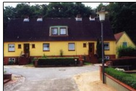
Das Grundstück am Ende des Wendehammers

Das Wetter in Heikendorf ist eigentlich immer gut! Nur hin und wieder hat man für das entsprechende Wetter nicht die richtige Kleidung an! Sollte es also mal kein Strandwetter sein, oder Sie machen Ihren Urlaub bei uns nicht im Sommer, dann bieten sich für Sie die vielfältigsten Aktivitäten; ob Tennis oder Golf, ob Hochseeangeln oder Radfahren, alles ist in der Nähe!