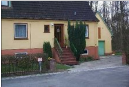
Eingangsbereich mit Parkplatz