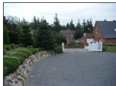
Blick zu den Nachbarn

Viel Natur in Form von Wiesen, Wald und Heide. Die reine Luft, geprägt durch die Nordseenähe, lädt zu Spaziergängen und Radtouren ein. Es sind viele Freizeitangebote vor Ort und in der Umgebung vorhanden. Beheiztes Freibad, Kinderspielplatz und Sportplatz 2 Minuten vom Haus entfernt. Bis zur Nordsee sind es etwa 8 Km. Der Bäcker ist circa 300 m von uns entfernt. Supermärkte im Umkreis von 4 Km.