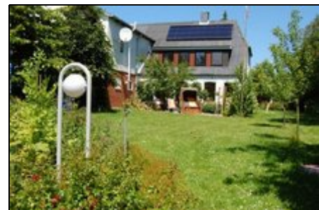
im Strandkorb relaxen

Man kann ausgedehnte Radtouren unternehmen, mit Rollerblades oder auch in gesunder Luft spazieren, im Watt baden, am grünen Strand auf dem Deiche liegen oder im Högler Freibad oder Bredstedter Erlebnisbad. Unsere ganz besondere Attraktion ist natürlich das Watt mit seinen vielen Möglichkeiten. Das beliebteste ist ein Spaziergang von Lüttmoorsiel zu der Hallig von Nordstrandischmoor oder zur Hamburger Hallig. Schiffstouren zu den Seehungbänken oder auf die Inseln sind in.