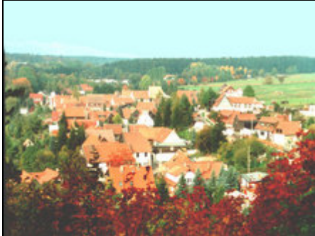
Ansicht von ELBINGERODE

Herzlich Willkommen in unserer gemütlichen und kinderfreundlichen Ferienwohnung in Elbingerode!