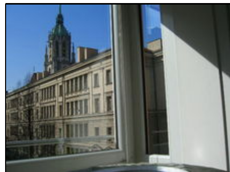
Blick auf die St. Pauls-Kirche

Die Ferienwohnung liegt max.10 Gehminuten (700m) vom Hauptbahnhof entfernt. Die Theresienwiese erreichen Sie in 5 und die Fußgängerzone (Karlsplatz/Stachus) in ca. 10 Gehminuten. Alle Geschäfte des täglichen Bedarfs incl. Aldi, Lidl, Netto, Bäckereien, Metzgerei und Obstläden sowie zahlreiche Restaurants, auch McDonalds, Apotheken, Banken sind in nächster Nähe. Die nächste U-Bahn Station (U4, U5) ist ca. 90m entfernt, von dort aus sind sie nach 1-3 Stationen am Hauptbahnhof oder Marienplatz.