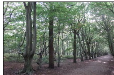
Die wunderschöne Natur in der Umgebung

Sie prüfen das Meer und Stress und Sorgen vergehen. Sie machen Urlaub in eine wunderschöne Umgebung. Das Verkehrsamt VVV bietet viele Ausflügmöglichkeiten, z.B. Vlissingen (MUZEEUM, Het Arsenaal, Hafen, Michiel de Ruyter, Zentrum, Kino); Zoutelande gibt schöne Aussichten übers Meer mit vielen grossen Schiffen und schöne Spaziergängen über die hohen Dünen; Domburg hat ein Subtropisches Schwimmparadis und ist sehr gemütlich; Veere hat viel Wassersport und in Middelburg gibt es viele Monumente.