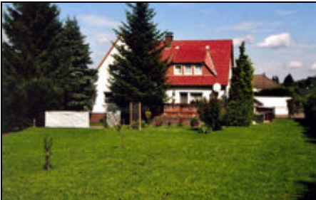
Ferienwohnung im 1. OG

Es erwartet Sie eine 80 qm große Nichtraucher-Ferienwohnung. Die ruhig gelegene, gemütliche Wohnung liegt im 1.OG auf einem großen Grundstück.