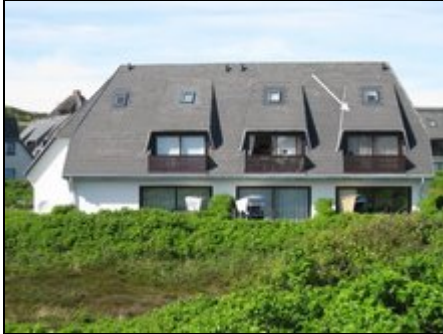
Rüm Hart I - Südansicht