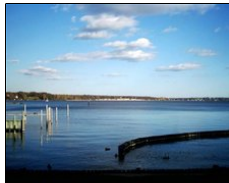
Wunderschöne Seenlandschaft am Wannensee

Die Villa liegt landschaftlich reizvoll am Wasser ggü. der Pfaueninsel in schönem Seengebiet. Sehr verkehrsgünstig zur City: Bus alle 10-20 Minuten zu Hauptstadtattraktionen, MESSE, ZOB, ICC, Olympiastadion, ZOO. Stündlich nach Potsdam zu den Schlössern + UNESCO-Welterbe. Freizeitaktivitäten: Golf, reiten, wandern, angeln, radfahren, schwimmen, Beach-Volleyball, Tennis, Squash. Sehr gute Einkaufsmöglichkeiten bis 22 Uhr + Restaurants/Bars in der Nähe. Hier finden Sie alles was das HERZ begehrt!