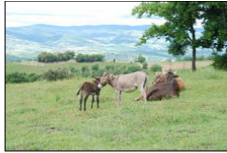
Kuehe und Esel auf der Weide