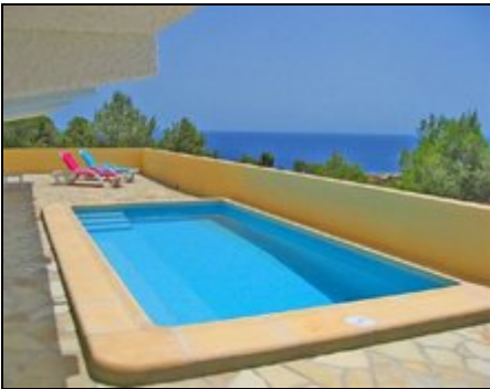
Pool mit Meeblick