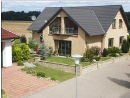
Südseite, FEWO im linken Flügel

moderne, idyllisch dennoch zentral gelegene Ferienwohnung für 2 Personen 38,- €/Nacht, sep. Eingang, Terasse, Hund/Haustier möglich.