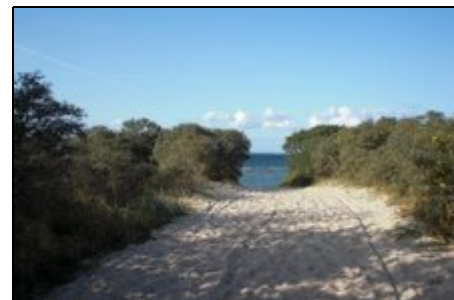
Weg zum Strand

Barendorf liegt an der Nordwestmecklenburgischen Ostseeküste im reizvollen Landschaftsschutzgebiet 'Klützer Winkel'. Direkter Blick auf die Lübecker Bucht, nur 10 Gehminuten vom Ostseestrand entfernt. Im Ort gibt es einen kleinen Einkaufsladen mit frischen Brötchen und Zeitungen sowie einem Eiscafe und eine Dorfgaststätte. Es gibt einen Randwanderweg entlang der Ostsee durch die herrliche Naturlandschaft nach Travemünde (ca. 6 km) und über Groß Schwansee nach Boltenhagen (ca. 19 km).