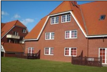
Haus in Barendorf mit Schwimmbad

Neue, sehr schöne, komfortable Ferienwohnung mit Schwimmbad für bis zu 4 Personen. Die Wohnung hat ca. 60 qm Wohnfläche. Ein Balkon ist vorhanden.