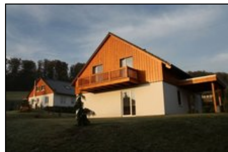
Haus Harzblick II

Sehenswert sind die ebenso die gepflegten Kuranlagen und das vielfältige Unterhaltungsprogramm der Stadt Bad Gandersheim. Zum Beispiel die alljährlichen Domfestspiele, welche zu den traditionsreichsten Freilichtspielen Deutschlands gehören. Das Therapie-, Sport- und Gesundheitsangebot in der romantischen Kurstadt ist breit gefächert und lässt kaum Wünsche offen. Die Ferienwohnungen laden mit ihrer zentralen Lage zwischen Harz und Weserbergland zum Erkunden der Natur und der Region ein.