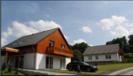
Haus Harzblick II