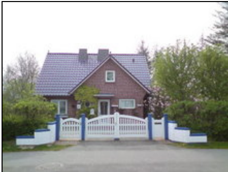
unser Haus Lykkebo von vorne

Ferienwohnung am Rande von Arnis - eine Halbinsel der Schlei - ein Ostseefjord. Viel Grün, Sonnenuntergänge, Wassersport, alles was Spaß macht.