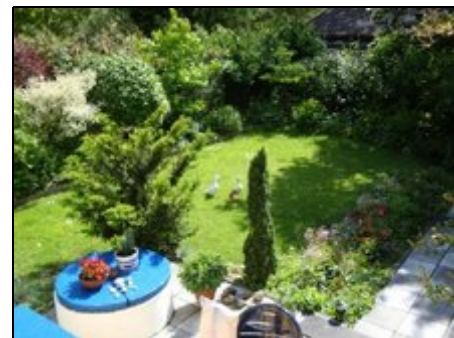
ein kleiner Teil des großen Gartens

Die Schlei ist bekanntes Segel- und Surf- und Kiterevier. Nahe der Ostsee bleiben keine Wünsche offen. Jung und Alt haben hier ihren Spaß. Maasholm als Kite- und Surfparadies ist nur 10 Kilometer entfernt. Der Ostseestrand bei Kappeln ist leicht mit dem Rad zu erreichen. Segler haben das Wasser vor der Tür. Arnis hat einen schönen Badestrand an der Schlei. Viele Gaststätten in unmittelbarer Nähe erfüllen kulinarische Wünsche. Die Natur hinter dem Haus lassen Sie den Alltag vergessen.