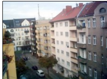
Eylauer Straße, 3. Haus, 1. OG, Mitte

Einen Steinwurf entfernt liegt der Viktoriapark mit seinem 66 Meter hohen Kreuzberg und dem Wasserfall. Dort oben hat man einen faszinierenden Blick über Berlin und seine Sehenswürdigkeiten, u.a. vom Sony-Center am Potsdamer Platz über die Siegessäule bis hin zum Gendarmenmarkt. Zu Fuß bequem erreichbar befinden sich preiswerte, jedoch gute Pizzerien. In wenigen Bezirken gibt es so viele Szenekneipen und -restaurants, Bars und Clubs .