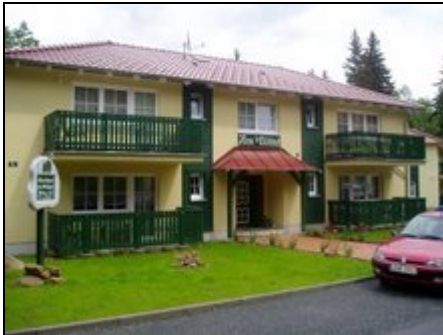
Aussenansicht Häuser "Kirchblick"

Unsere familiengeführte Ferienanlage liegt idyllisch am Wald, Ruhe und Natur PUR! 4 DZ+13 FEWO bieten komfortablen Urlaub, LASSEN SIE SICH VERWÖHNEN!!