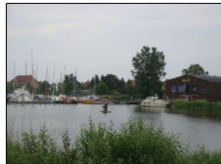
Yachthafen und Noor gegenüber

Die Schlei ist bekanntes Segel- und Surf- und Kiterevier. Nahe der Ostsee bleiben keine Wünsche offen. Jung und Alt haben hier ihren Spaß. Maasholm als Kite- und Surfparadies ist nur 10 Kilometer entfernt. Der Ostseestrand bei Kappeln ist leicht mit dem Rad zu erreichen. Segler haben das Wasser vor der Tür. Arnis hat einen schönen Badestrand an der Schlei. Viele Gaststätten in unmittelbarer Nähe erfüllen kulinarische Wünsche. Die Natur hinter dem Haus lassen Sie den Alltag vergessen. Lykkebo!!!