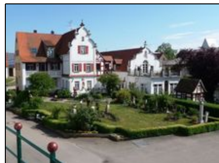
Aussicht vom Balkon (Schloßgarten)

Trochtelfingen liegt 7km vor den Toren Nördlingen. Von hier aus haben Sie die Möglichkeit, das wunderschöne Ries, das Altmühltal mit den großen Stauseen zu entdecken. Fahren Sie die Romantische Straße entlang nach Dinkelsbühl, Rothenburg. Genießen Sie mit Ihren Kindern das Legoland in Günzburg. Das Steiff-Museum in Giengen oder das Käthe Kruse Museum in Donauwörth. Das Härtsfeld lädt zum Wandern oder Langlauf-Ski ein. Aalen bietet die Limes-Thermen ein Bad im römischen Stil.