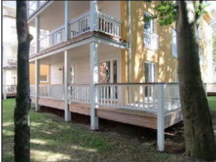
Außenansicht FeWo 4.0.N.