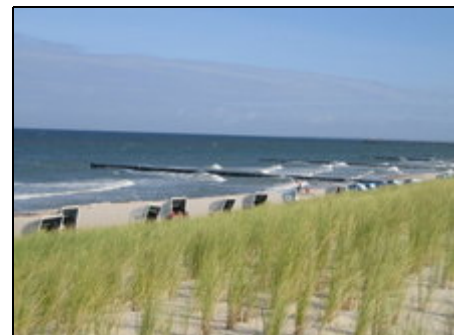
Dünenlandschaft mit Seebrücke

Zentral an der Küstenlinie zwischen Rostock und der Halbinsel Fischland-Darß gelegen, ist Graal-Müritz aus allen Richtungen gut zu erreichen. Graal-Müritz ist ein traditioneller Kurort direkt an der Ostseeküste gelegen. Mit seinen kilometerlangen Sandstränden und dem faszinierenden Blütenmeer des Rhododendronparks kann hier jeder seinen Passionen nachgehen. Eingebettet in eines der größten Waldgebiete Norddeutschlands finden Wanderer und Radfahrer gleichermaßen Erholung.