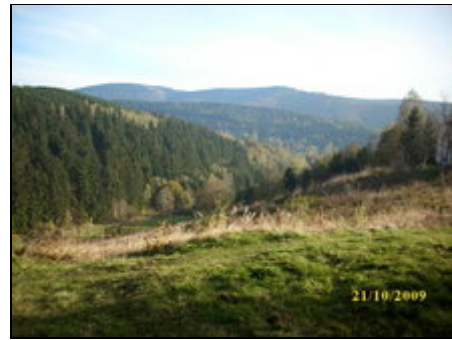
Gr.Eisenberg, Salzberg; vorn DürreLauter