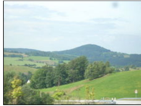
Die wunderschöne Umgebung von Lauenstein

Zu jeder Jahreszeit bietet unsere Region ausreichende Freizeitmöglichkeiten wie z.B. Wandern, Radfahren, Rafting, Langlauf, Abfahrt, Biathlon oder Bobfahren. In der näheren Umgebung kann man Bergwerke und den Wildpark erkunden. Im Ort befindet sich unser Freibad und der Reiterhof. Es gibt Falknervorführungen, Schlossbesichtigungen, den schiefen Markt, den sagenumwogenen Falknerbrunnen und jetzt neu das alte Stadttor wo auch George Bähr (Erbauer der Frauenkirche) einst immer durchging zu bestaunen.