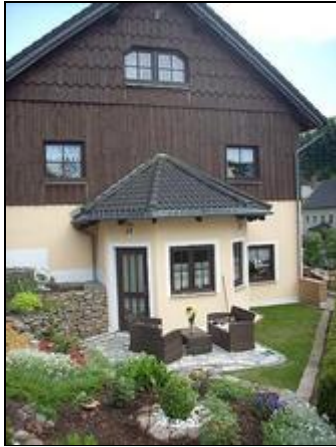
Hausansicht mit Fewo im 1.OG

Im Ort Lauenstein liegt unsere mit Liebe zum Detail eingerichtete große FEWO die keine Wünsche offen lässt. Kamin, Sauna und Wasserbett erwarten Sie.