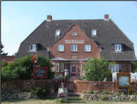
Das Kapitänshaus Klar Kimming auf Amrum

Das ist Amrum! Insel-Urlaub pur im Kapitänshaus Klar Kimming. Acht gemütliche Ferienwohnungen, 2800 qm-Inselgarten, Sauna und Weinbar im Haus!