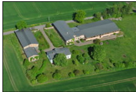
Der Hof Kreuzkamp aus der Luft

Inmitten des reizvollen Warnowtales, umgeben von Feldern und Wäldern liegt unser 1892 erbauter Bauernhof vor den Toren Rostocks. Unser Hof bietet einen idealen Startpunkt für Ausflüge zu den sonnigen Ostseestränden nach Warnemünde, Kühlungsborn, Heiligendamm, Fischland Darß oder Insel Rügen. Kulturliebhaber finden in Güstrow, Stralsund, Swinaun, Bad Doberan und Rostock zahlreiche Museen, Theater, Kinos und Kneipen. Für Natur- oder Tierparks reisen Sie nach Güstrow, Stralsund Marlow oder Rostock.