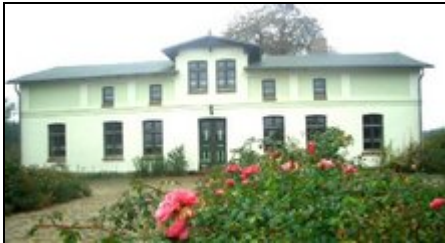
Unser altes Bauernhaus mit Rosenspalier

Sie besuchen einen über hundert Jahre alten typischen Mecklenburger Bauernhof. Hier erwarten Sie Landidylle, Gemütlichkeit und vor allen Dingen Ruhe.