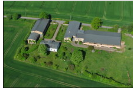
Flugbild vom gesamten Hof

Inmitten des reizvollen Warnowtales, umgeben von Feldern und Wäldern liegt unser 1892 erbauter Bauernhof vor den Toren Rostocks. Unser Hof bietet einen idealen Startpunkt für Ausflüge zu den sonnigen Ostseestränden nach Warnemünde, Kühlungsborn, Heiligendamm, Fischland Darß oder Insel Rügen. Kulturliebhaber finden in Güstrow, Stralsund, Swinaun, Bad Doberan und Rostock zahlreiche Museen, Theater, Kinos und Kneipen. Für Natur- oder Tierparks reisen Sie nach Güstrow, Stralsund Marlow oder Rostock.