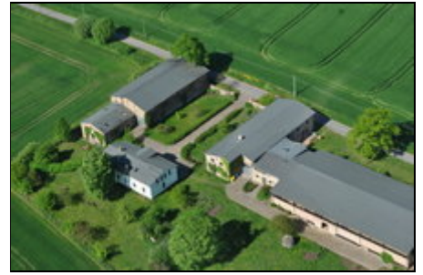
Luftansicht des Hofes Kreuzkamp 3

Inmitten des reizvollen Warnowtales, umgeben von Feldern und Wäldern liegt unser 1892 erbauter Bauernhof vor den Toren Rostocks. Unser Hof bietet einen idealen Startpunkt für Ausflüge zu den sonnigen Ostseestränden nach Warnemünde, Kühlungsborn, Heiligendamm, Fischland Darß oder Insel Rügen. Kulturliebhaber finden in Güstrow, Stralsund, Swinaun, Bad Doberan und Rostock zahlreiche Museen, Theater, Kinos und Kneipen. Für Natur- oder Tierparks reisen Sie nach Güstrow, Stralsund Marlow oder Rostock.