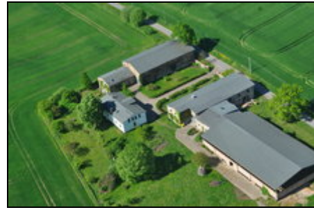
Flugansicht des Hofes

Inmitten des reizvollen Warnowtales, umgeben von Feldern und Wäldern liegt unser 1892 erbauter Bauernhof vor den Toren Rostocks. Unser Hof bietet einen idealen Startpunkt für Ausflüge zu den sonnigen Ostseestränden nach Warnemünde, Kühlungsborn, Heiligendamm, Fischland Darß oder Insel Rügen. Kulturliebhaber finden in Güstrow, Stralsund, Swinaun, Bad Doberan und Rostock zahlreiche Museen, Theater, Kinos und Kneipen. Für Natur- oder Tierparks reisen Sie nach Güstrow, Stralsund Marlow oder Rostock.