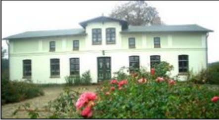
Ferienwohnungen im Bauernhaus

Sie besuchen einen über hundert Jahre alten typischen Mecklenburger Bauernhof. Hier erwarten Sie Landidylle, Gemütlichkeit und vor allen Dingen Ruhe.