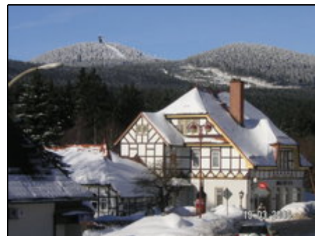
Blick auf die Wurmbergschanze

Die Harzer Schmalspurbahn und die Brockenbahn mit Ihren historischen Dampfloks sind beliebte Verkehrsmittel, um die Harzlandschaft kennenzulernen. Mit der Kremserkutsche können Sie ebenfalls Ausflüge in den Nationalpark Hochharz und zum Brocken unternehmen. Die alte Fachwerkstadt Wernigerode mit dem historischen Schloß sind interessante Ausflugsziele. Das idyllisch gelegene Waldbad in Elend oder das Bergtheater in Thale warten auf Ihren Besuch.