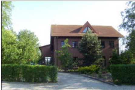
Landhaus Hofmann Polchow

Unser gepflegtes Landhaus mit 18 gemütlichen Wohneinheiten liegt in absolut ruhiger Lage, mit Seeblick zum Jasmunder Bodden .