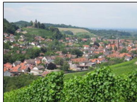
Kappelrodeck inmitten der Weinberge

Kappelrodeck ist der größte Ort in der Ferienregion Achertal. Beliebt sind nicht nur die Weinwanderungen durch die Rebberge sondern auch die zahlreichen Feste auf dem Markplatz. Lassen Sie sich verwöhnen mit den Genüssen der Region und den ausgezeichneten Rotweinen. Die Region und die umliegenden Berge des Nordschwarzwaldes sind ein ideales Urlaubsparadies für Wanderer und Genießer. Ganzjähriges vielfältiges Veranstaltungsprogramm. Schönes Freibad 500m, Badesee 10km.