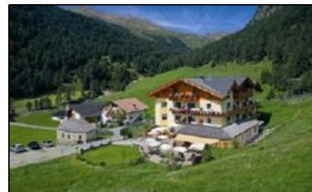
Inner-Glieshof mit Umgebung