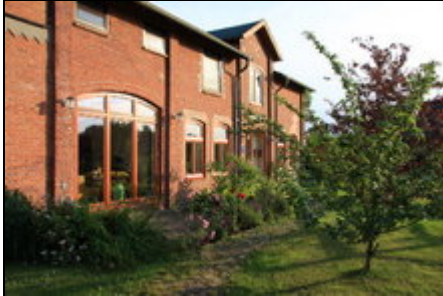
Ferienwohnung Hof Nordwind

Die helle und geräumige Ferienwohnung ist 130 qm groß und liegt im Obergeschoss unseres renovierten ehemaligen Bauernhauses in Osterrade m.eig. Garten